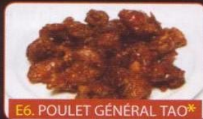
E6. POULET GÉNÉRAL TAO*