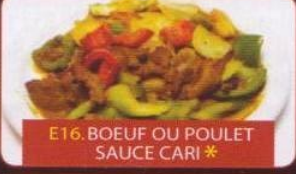
E16. BOEUF OU POULET SAUCE CARI *