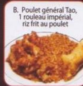
B. Poulet général Tao, 1 rouleau impérial, riz frit au poulet