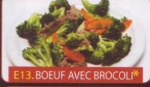
E13. BOEUF AVEC BROCOLI*