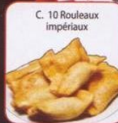
C. 10 Rouleaux impériaux