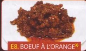
E8. BOEUF À L'ORANGE*