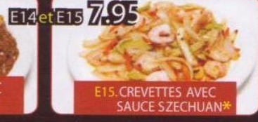
E15. CREVETTES AVEC SAUCE SZECHUAN*