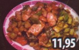
K41 Poulet à la sauce Kon Pao 11,95