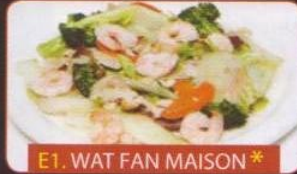
E1. WAT FAN MAISON *