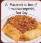
A. Macaroni au boeuf, 1 rouleau impérial, Soo Guy