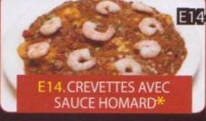
E14. CREVETTES AVEC SAUCE HOMARD*