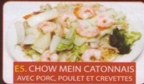
E5. CHOW MEIN CATONNAIS AVEC PORC, POULET ET CREVETTES