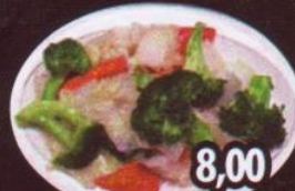
K90 Légumes chinois 8,00