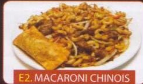
E2. MACARONI CHINOIS