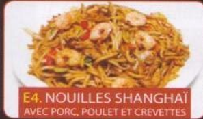
E4. NOUILLES SHANGHAI AVEC PORC, POULET ET CREVETTES