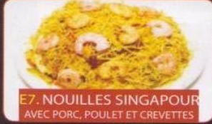
E7. NOUILLES SINGAPOUR AVEC PORC, POULET ET CREVETTES