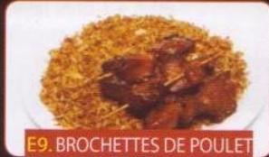
E9. BROCHETTES DE POULET