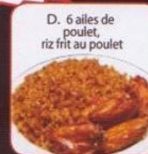
D. 6 ailes de poulet, riz frit au poulet