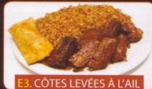
E3. CÔTES LEVÉES À L'AIL