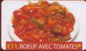
E11. BOEUF AVEC TOMATES*