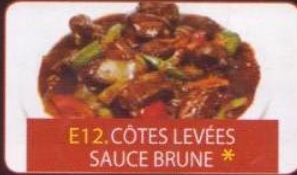
E12. CÔTES LEVÉES SAUCE BRUNE *