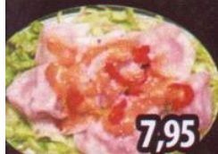
K5 Ravioli à la sauce au beurre d'arachide 7,95

Pour • For 1 18.95 Pour • For 2 34.95 Pers. Add. 18.00