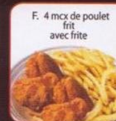
F. 4 mcx de poulet frit avec frite