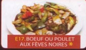
E17. BOEUF OU POULET AUX FÈVES NOIRES *